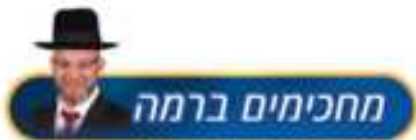
הרה"ג אליהו חי אביטן שליט"א

"אתה רואה, אתה עבד! אין לך שום דעה מעצמך!" חזר שוב ושוב... "טוב עכשיו עצבנת אותי, עד כה הייתי עדין איתך, אז רק שתדע, מי שפה עבד זה אתה!!!" הוא הסתכל עלי בפרצוף עקום... "חחח, אני עבד??? איך??? אני זה שרואה טלוויזיה!" "זהו! זאת בדיוק הבעיה! ולכן אתה עבד. תקשיב חביבי חשבון פשוט. לי יש אפשרות להחליט, האם לראות טלוויזיה או לא, החלטתי שלא ב"ה, אבל אתה, אין לך שום אפשרות לבחור האם לראות או לא! אתה לא מסוגל לעזוב את המסך! נו? אז מי פה עבד???" 'בן חורין', מלשון 'בחירה', משהו שיש לו אפשרות לבחור! אם אין לך אפשרות לבחור... אתה נחשב עבד!