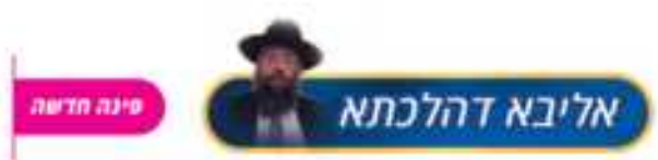
הרה"ג בנימין חותה שליט"א מתוך שו"ת אליבא דהילכתא ד"ח

שאלה: ישנם שבעה רקיעים, אותם הרוגי מלכות שמתו על קידוש ה' באיזה היכל הם נמצאים? תשובה: הנה על פי הוזהר פרשת פקודי הסדר כדלהלן: הראשון היכל לבנת הספיר, שם הגרים ובראשם אונקלוס. השני היכל עצם השמים, שם בעלי הייסורים ומשיח בן דוד בראשם. השלישי היכל נוגה, שם הנפטרים צעירים שלא השלימו לימודם, ומשיח מלמדם. הרביעי היכל הזכות, שם הרוגי ישראל מהאומות, ובראשם רבי עקיבא. החמישי היכל אהבה חסד, שם בעלי תשובה ובראשם מנשה בן חזקיהו. השישי היכל הרצון, שם הנוהגים בחסידות יתירה וסיגופים, האבות הקדושים כי בהיכל זה נמצאים כל הצדיקים אשר ניקו עצמם מכל זוהמא ומכל גשמיות בעולם הזה וזכו ללבוש כאן בגד של עולם הבא. השביעי היכל קדש קדשים, נעלם מכולם ומאיר לכולם, ואין ידוע מה יש שם.